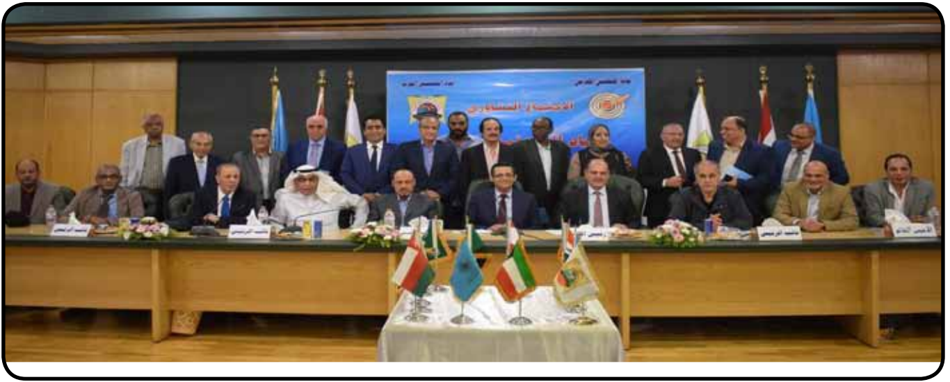
الاجتماع التشاوري لاتحاد الصحفيين العرب بمقر نقابة الصحفيين