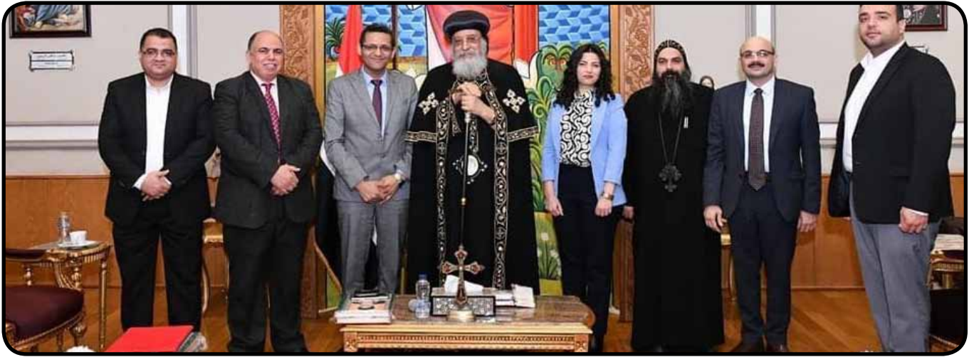
لقاء مع قداسة البابا تواضروس الثاني