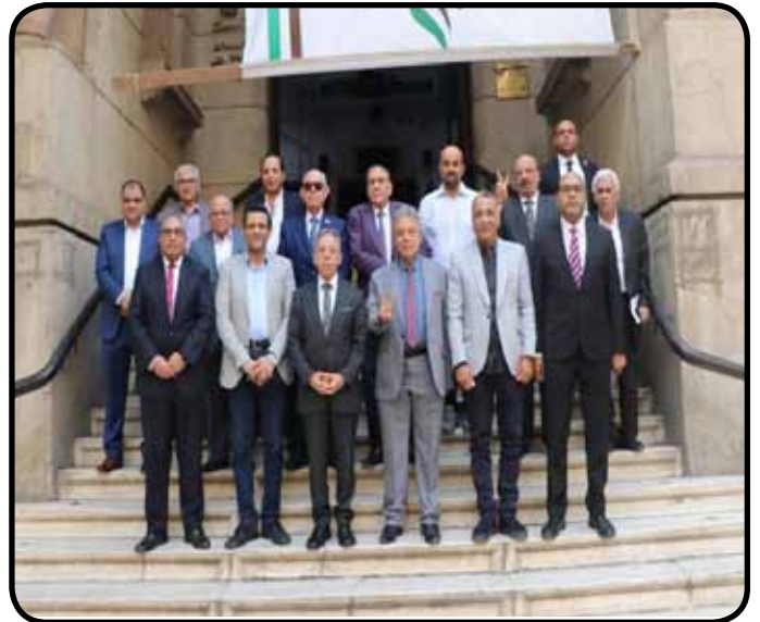
لقاء النقابات المهنية لدعم غزة بنقابة الاطباء