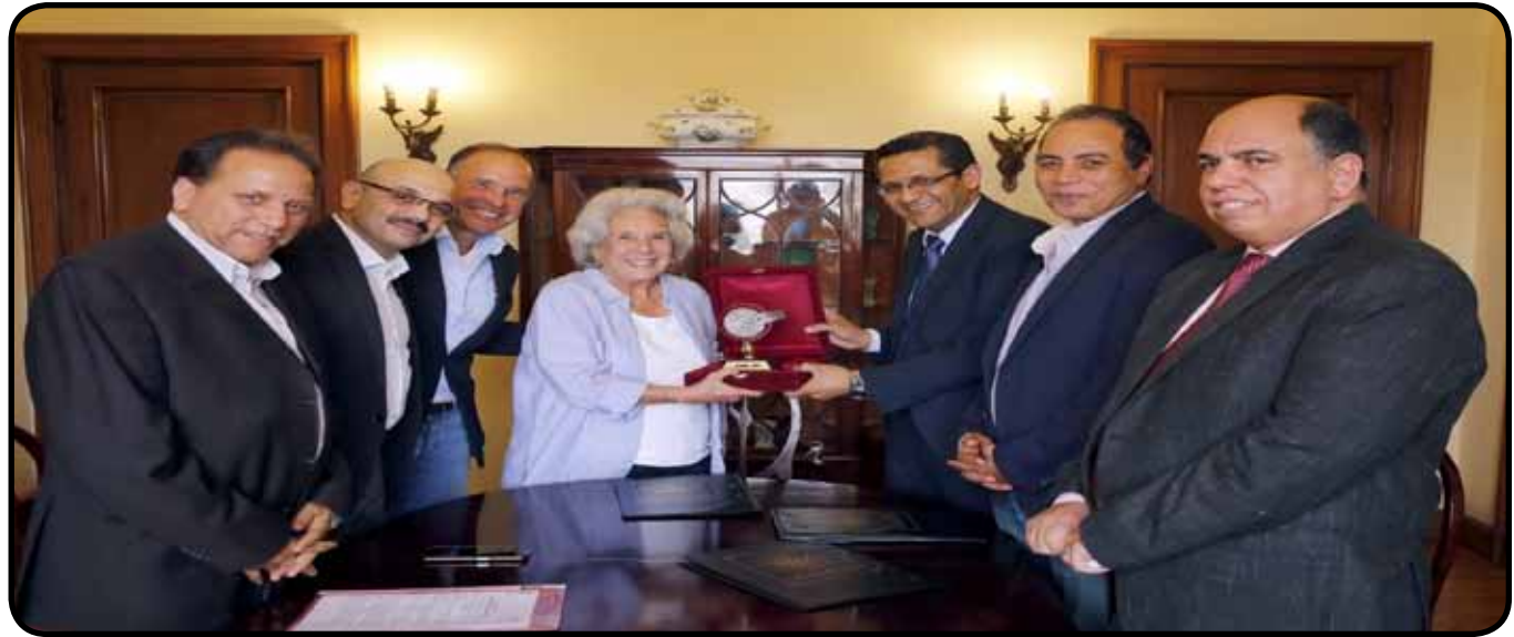
توقيع بروتوكول تعاون مع «مؤسسة هيكل» لتدريب وتطوير مهارات الصحفيين