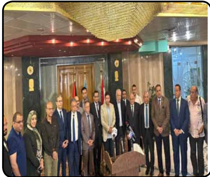
لقاء النقابات المهنية لدعم غزة بنقابة الصحفيين