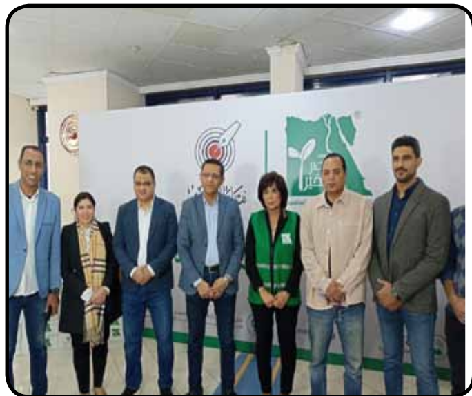
نقابة الصحفيين ومصر الخير يدشنان شحنة مساعدات غذائية وطبية لأهالي قطاع غزة