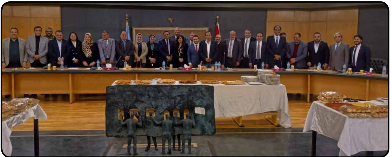
لقاء مع النواب الصحفيين بمجلسي النواب والشيوخ (٤)