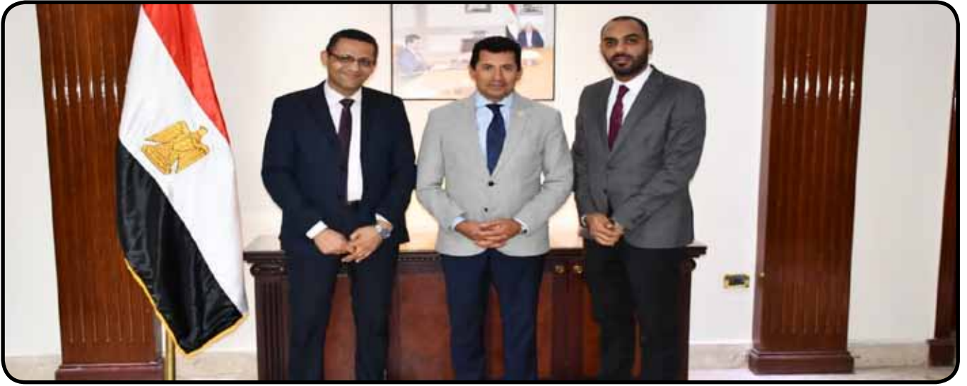
لقاء مع معالي الدكتور أشرف صبحي وزير الشباب والرياضة