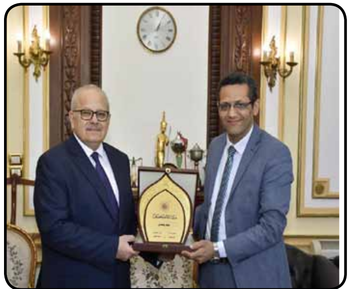
لقاء مع الدكتور محمد عثمان الخشت رئيس جامعة القاهرة