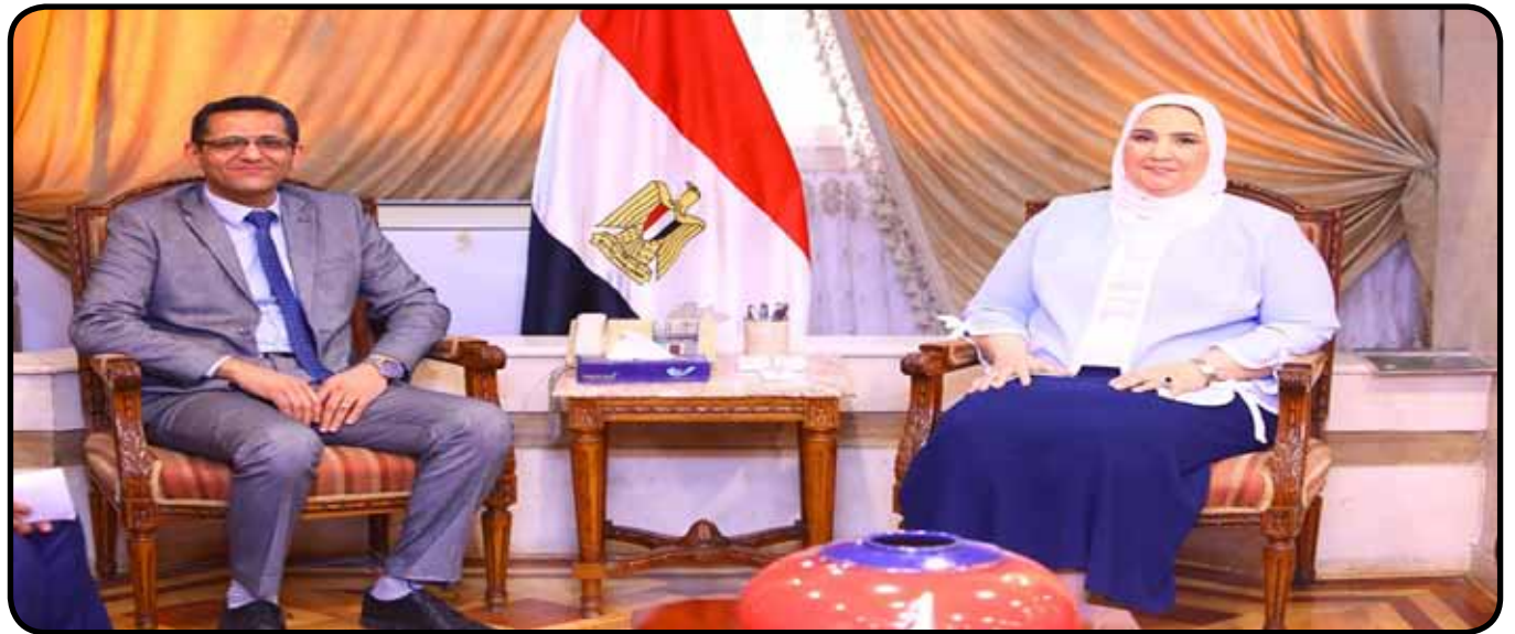
لقاء مع معالي الأستاذة نيفين القباج وزيرة التضامن الاجتماعي