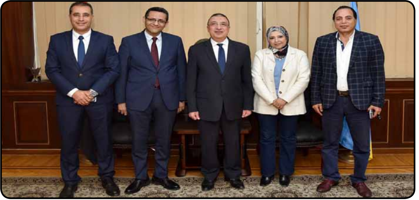
لقاء مع اللواء محمد الشريف محافظ الإسكندرية